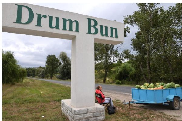
album Tiraspol Transnistrie